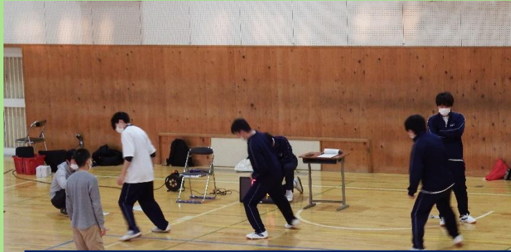
【5月1日（月）身体測定・新体力テストの様子】