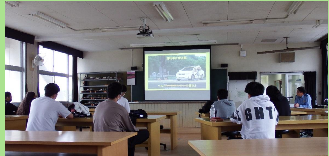
【5月19日（金）交通安全講話の様子】

関警察署 交通課の方にお越しいただき、 「自転車運転の安全」についての講話を 聞きました。登下校をはじめ、安全な 自転車運転につなげてほしいです！