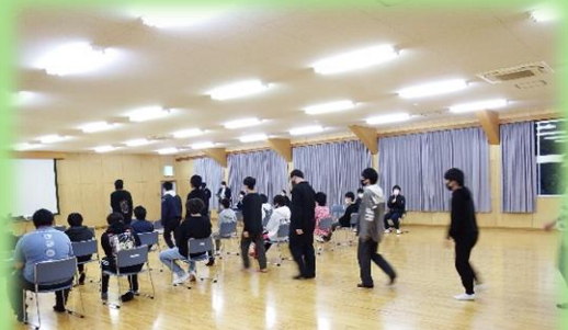
新入生入場の様子

4月13日(火)に教務・生徒指導オリエンテーション、4月14日(水)に新入生歓迎会が行われました。学校生活が本格化していきます。