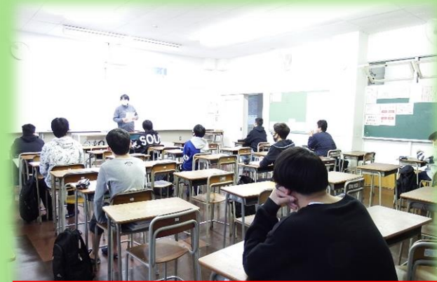
教務オリエンテーション（教室にて）の様子