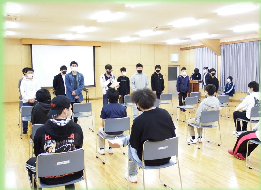
新入生による自己紹介 新入生がひとりひとり自己紹介をしました