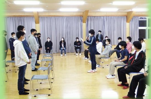
生徒会からの歓迎の言葉 新入生に向けたあたたかい言葉が印象的でした