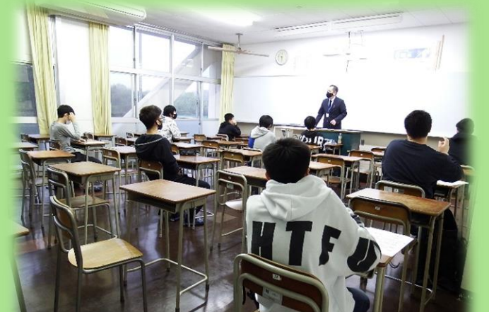
生徒指導オリエンテーション（教室にて）の様子