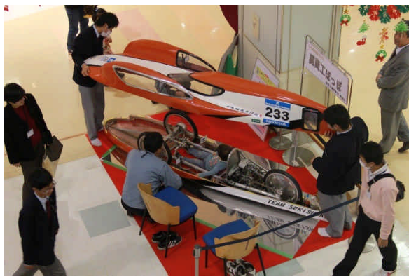
今年もエコランカーちびっこ試乗会開催