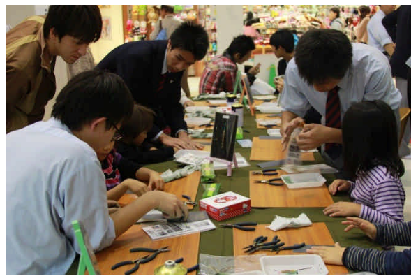
相変わらず人気。ハートストラップ製作コーナー