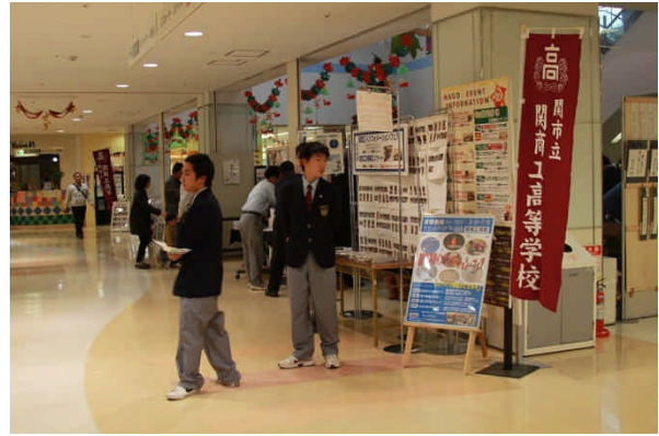
インフォメーションコーナー 資料が充実