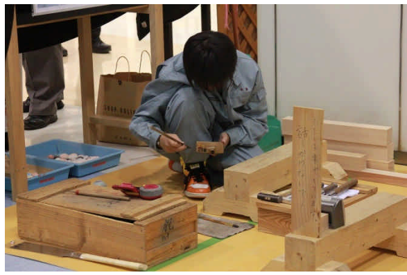
木材加工を女子生徒が実演しました。迫力あり！