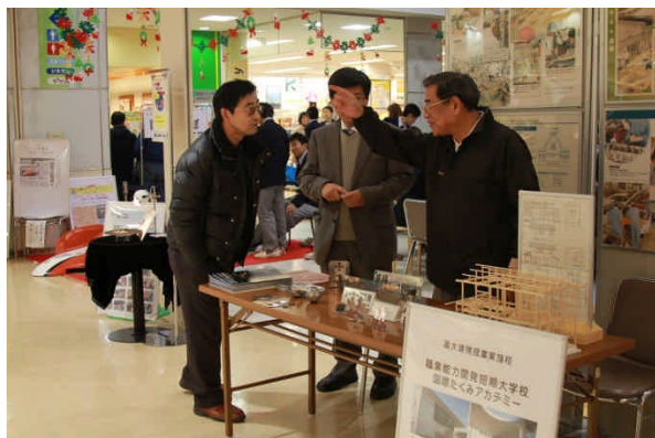
連携校、国際たくみアカデミーインフォメーションブース