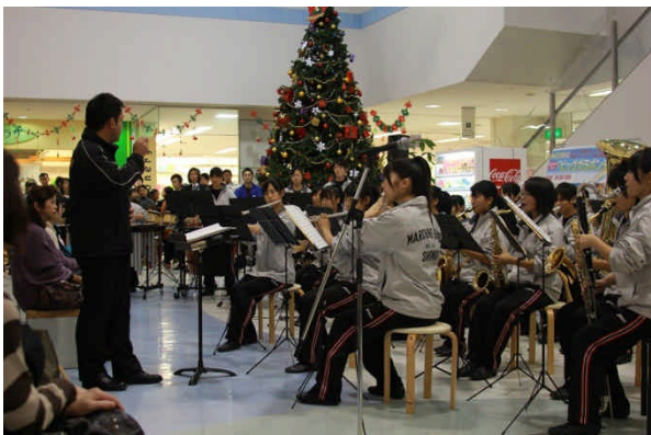
今年もフィナーレは吹奏楽部ヒットパレード！