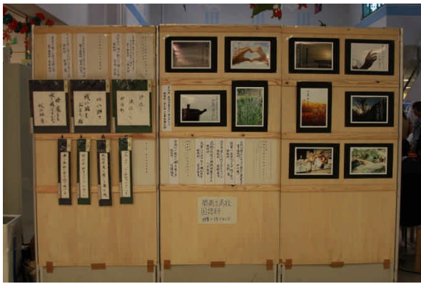
俳句コーナー 写真と俳句のコラボもあり